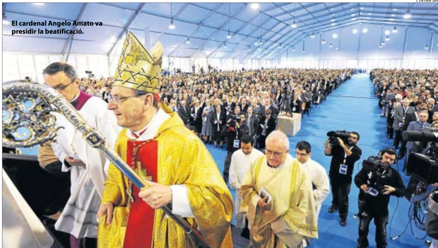
El cardenal Angelo Amato va presidir la beatificació.