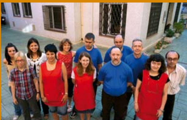
Taller de Manipulats i Manualitats