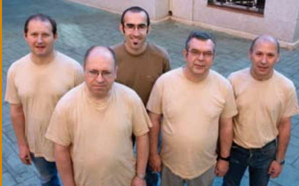
Taller de Fusteria

Per a poder consolidar aquest projecte considerem que és molt important el fer arribar a tota la societat la vida real d'aquestes persones i les possibilitats i capacitats que tenen. Els nostres productes artesans porten darrera moltes hores, moltes il·lusions, molt esforç de tot l'equip i estan pensats per a persones que valoren i volen contribuir a crear el món més just per a tots. Tots conjuntament podem fer del nostre somni una realitat amb la compra social.