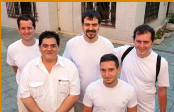
Taller de Pintura