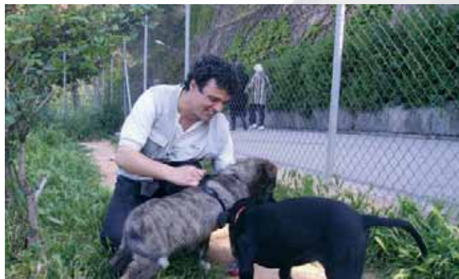
Un dels voluntaris del Club d'AREP passeja un gos del Centre d'Acollida d'Animals...

Per a més informació: 93 352 13 39 o www.arep.cat