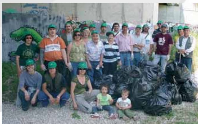
Els participants es van fotografar en acabar la jornada al costat de les bosses de la brossa recollida.

Per a més informació: 977 520 205 o www.tinet.org/~aurora