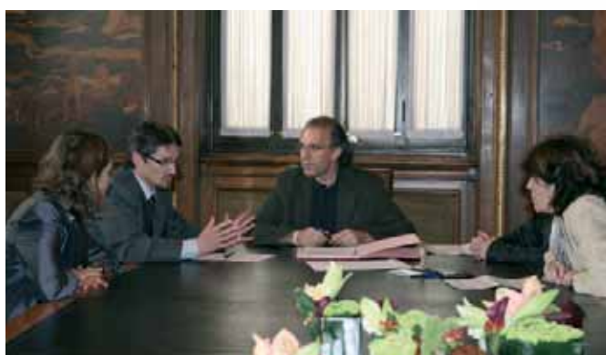
Acte de signatura del conveni entre la Federació i l'IMD de Barcelona el passat mes de maig.

Mitjançant aquest conveni, les dues entitats es comprometen a col·laborar en el desenvolupament d'activitats dirigides a la prevenció, l'atenció, la integració i la promoció en general del benestar de les persones amb malaltia mental i les seves famílies a la ciutat de Barcelona.