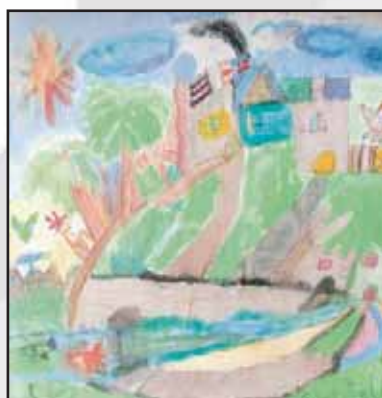
La Natura (2n premi)