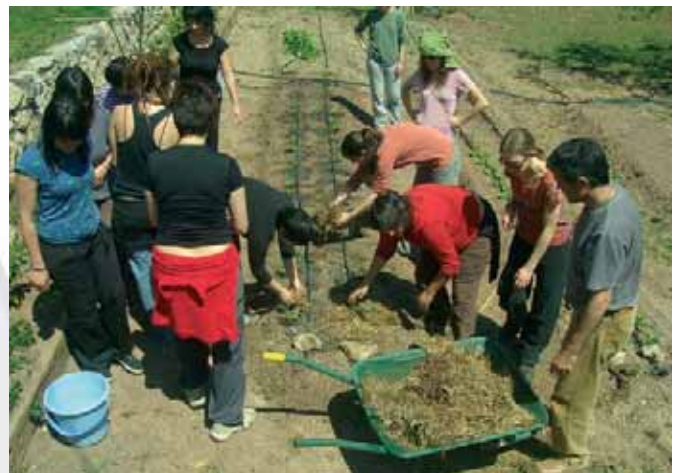
Professionals dels Clubs participen en una sessió pràctica sobre horticultura en un hort de La Llacuna, a l'Anoia.

Aquesta és una experiència nova en l'àmbit dels Clubs socials amb persones amb malaltia mental.