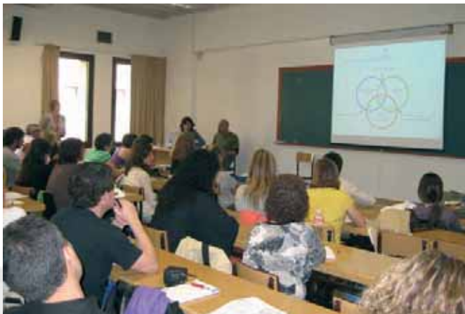
Moment de la intervenció dels representants dels Clubs socials de la Federació al Congrés de Bilbao.

Entre els dies 5 i 7 de juny es va celebrar a Bilbao el II Congrés de la Federació Espanyola d'Associacions de Rehabilitació Psicosocial, organitzat per l'Asociación Vasca de Rehabilitación Psicosocial - ASVAR. La trobada va aplegar a professionals de la salut que treballen en el camp de la rehabilitació en salut mental de tot l'Estat espanyol.