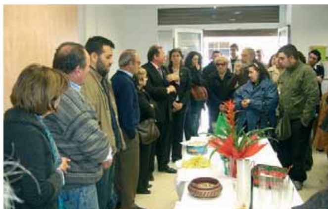
L'Associació de Rubí, Sant Cugat i Castellbisbal celebra la inauguració del seu nou local.

Per a més informació: 661 281 450 o afmmr@hotmail.com