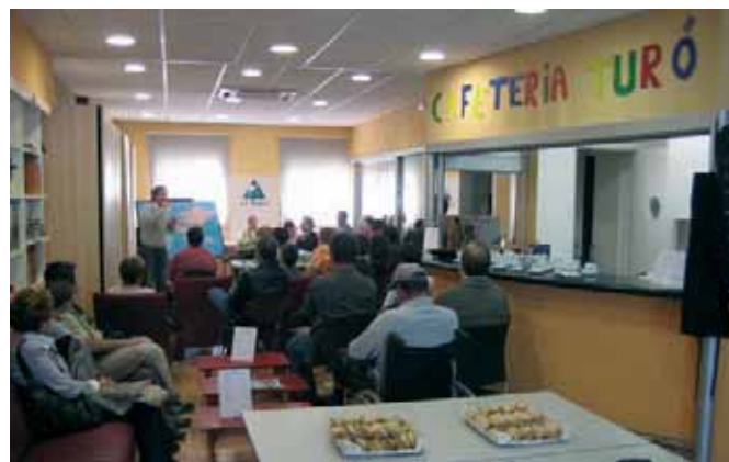
Moment de la inauguració de la Cafeteria El Turó, autogestionada per persones amb malaltia mental.

Per a més informació: 93 892 08 24 / 660 093 610 o www.elturo.cjb.net