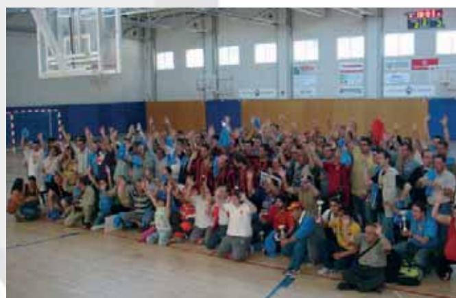
Moment final de l'acte de la cloenda de la lliga de futbol-sala de Clubs socials amb tots els participants.

Un cop més, es demostra com l'activitat esportiva és una via per a la millora significativa de la qualitat de vida de les persones que tenen alguna malaltia mental així com dels seus familiars.