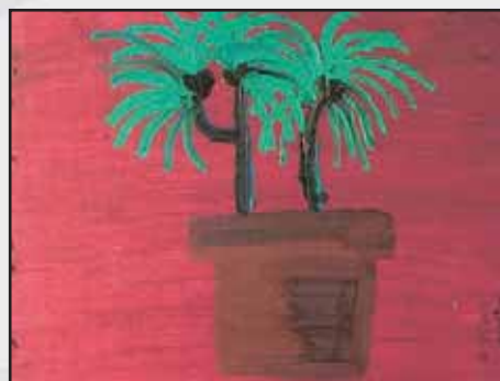
Las palmeras (3r premi)