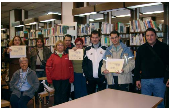
Alguns dels concursants i premiats pel concurs de fotografia amateur de Santa Coloma.

Per a més informació: 93 468 46 27 o ammamesc@yahoo.es