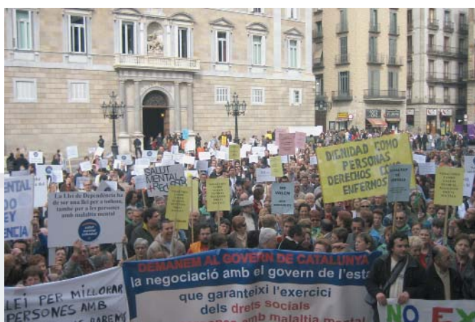
Més de 500 persones ens vam aplegar a la Pl. Sant Jaume.

Davant el temor que l'instrument de valoració que donarà dret a les ajudes i serveis de la Llei de Dependència excloués gran part de les persones amb trastorn mental sever, professionals del sector van passar l'instrument d'avaluació entre 83 persones afectades. El 80 % van obtenir menys de 25 punts, el mínim per ser considerat dependent moderat i tenir accés a les ajudes, i gran part de les que sí que puntuaven, ho feien en el graó més baix.