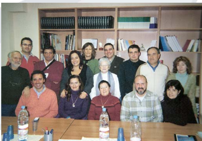
Foto de família dels assistents a la reunió sobre el projecte italià d'investigació de la rehabilitació a través de l'esport.

Fruit del contacte d'una delegació italiana amb el Centre Assistencial Emili i Mira (CAEM) el passat 23 de gener va tenir lloc una reunió a la Federació per tal de col·laborar en un projecte europeu de formació presentat per Itàlia per formar professionals d'aquest país per a una investigació sobre la rehabilitació a través de l'esport. El projecte, anomenat "Leonardo Da Vinci Mobility Project - Spot Light", està en una primera fase de recollida d'informació directa a les famílies i usuaris en relació als beneficis obtinguts en els seus processos de rehabilitació amb la pràctica de l'esport.