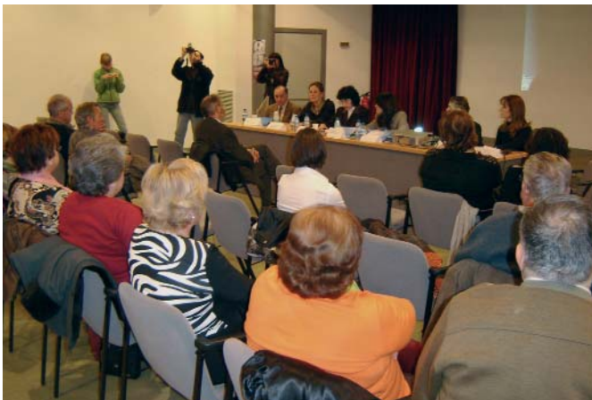
L'Associació Porta Oberta de Valls es presentà a la ciutat el passat mes de gener.

Per a més informació: 977 604 967 o portaobertaassociacio@portalmix.zzn.com